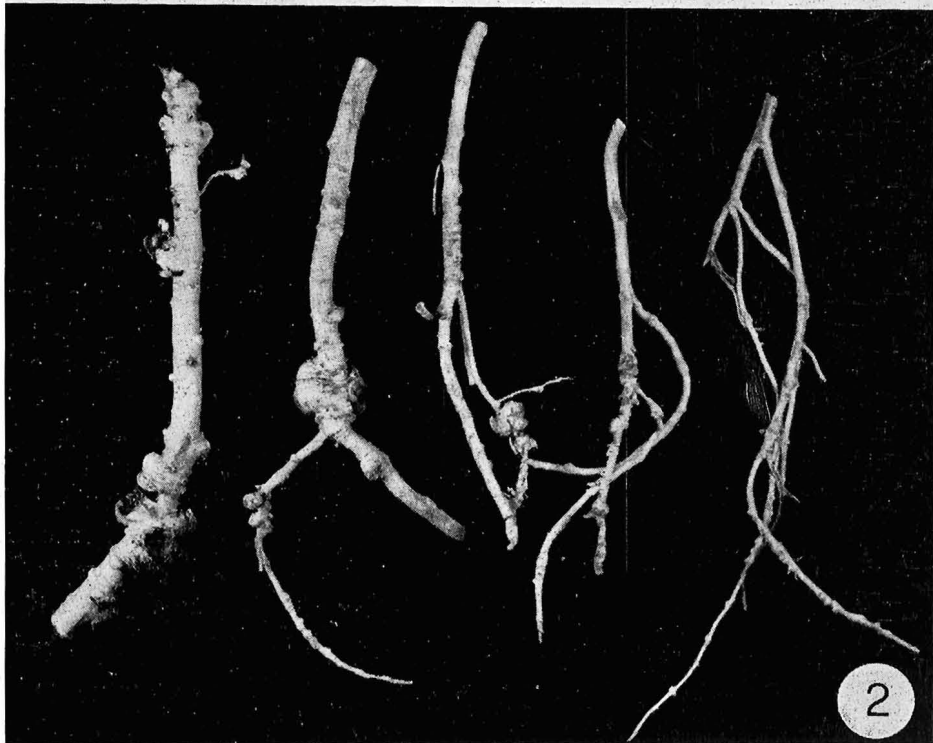
Fig. 1 - Una coltivazione di Papaya in serra, in Sicilia. Fig. 2 - Radici di Papaya con galle indotte da Meloidogyne javanica .