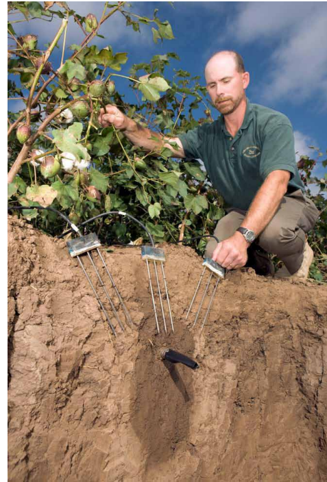
Figure 3. SDI colocado profundamente en un campo de algodón permite una larga vida útil y evita la interferencia con la labranza. El uso de sondas de monitoreo permite la medición del agua en el suelo.

flujo de agua de SDI es generalmente menos de 3 galones por hora. SDI puede tener una vida útil de hasta 20 años, lo que le convierte en el método más económicamente competitivo junto al riego por pivote central en sistemas de cultivo por hilera (Lamm et al. 2010).