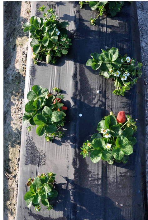
Figure 1. Riego por goteo aplicado a la superficie para la producción de fresas.

Mientras que la toma de decisiones en la agricultura involucra otros aspectos que van más allá del clima, incluyendo la economía, factores sociales y las consideraciones de las políticas, los riesgos relacionados al clima son la fuente principal del rendimiento y de la variabilidad en los ingresos. Las estrategias existentes pueden ayudar a los productores a minimizar los riesgos asociados con la variabilidad y el cambio climático también como mejorar la eficiencia del uso de los recursos existentes en la finca. Esta serie de publicaciones EDIS ofrece información sobre las tecnologías existentes, y esta publicación se enfoca en el uso del riego localizado para mejorar los sistemas de producción.