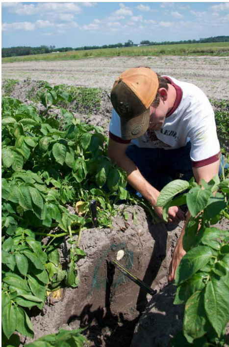
Figure 2. Riego por goteo subterráneo (SDI) para las patatas en Hastings, Florida.