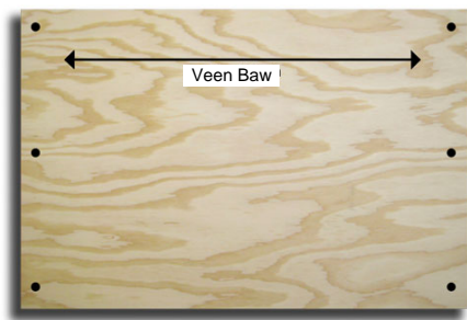
Plywood pi fò nan direksyon venn bwa-a.

Paske panno plywood pa diré lontan, pwa panno-a, ak tan ke sap pran pou enstalé, nou rekòmandé ke nou pa itilizé-yo a mwen ke nou pa genyen lòt bagay. Pase pran dokiman nou-an ki réle “Enstalé Panno Siklòn Pou Fénèt” pou nou kapab étidyé lòt altènatif.